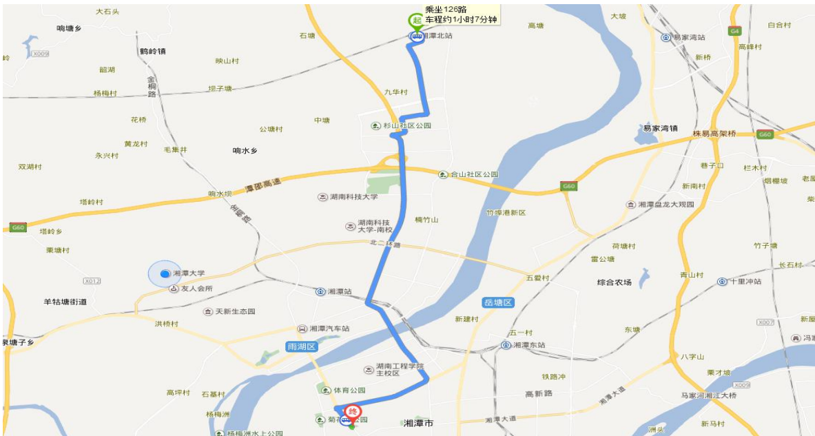
湘潭北站至华宇国际酒店路线图