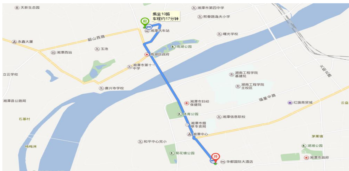
湘潭长途汽车站至华宇国际酒店路线图